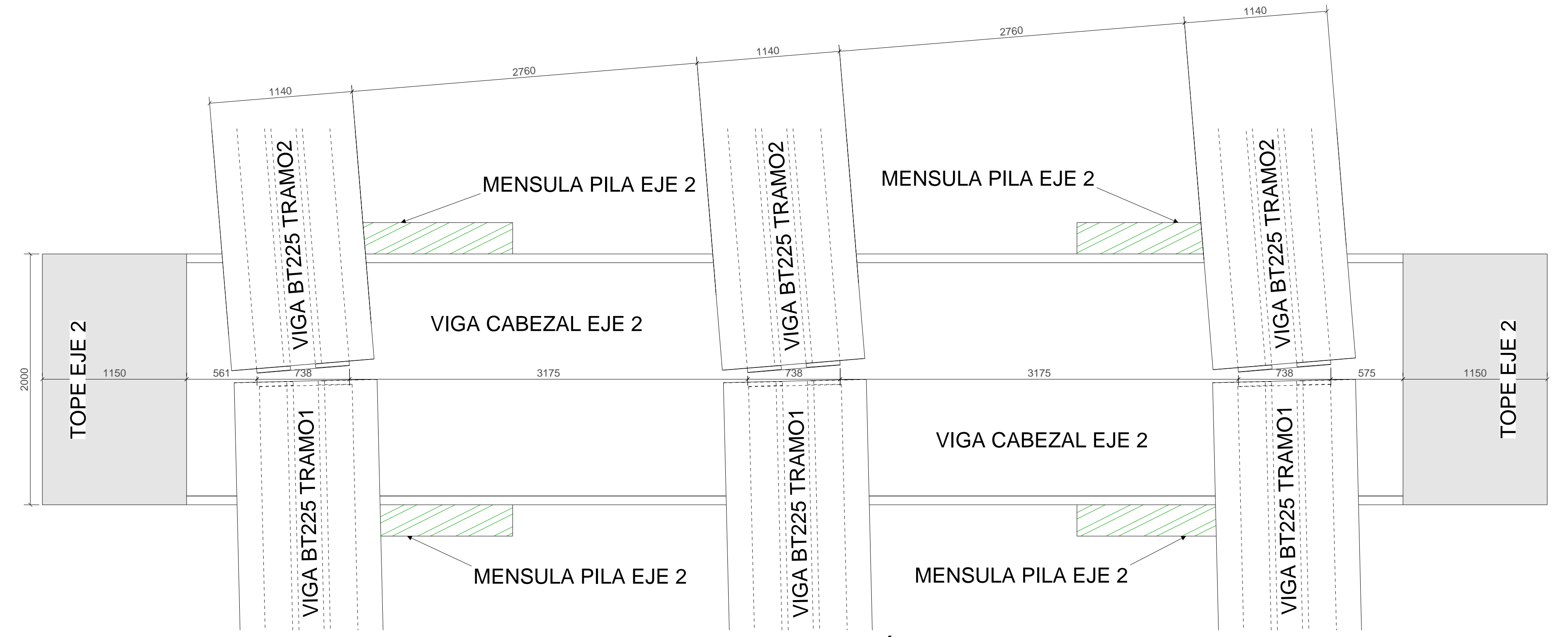
VISTA EN PLANTA - LOCALIZACIÓN GENERAL Esc: 1:25