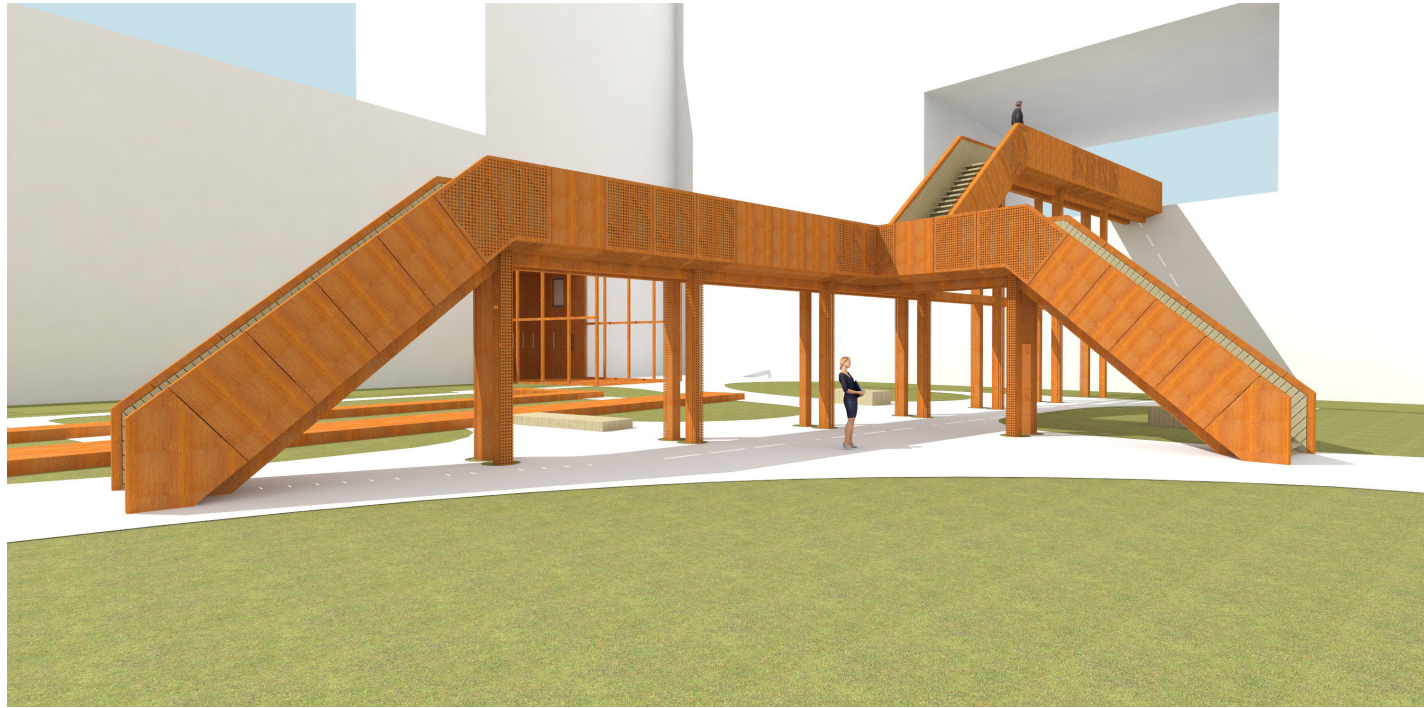
visualisatie van de gehele trap-brug