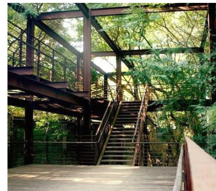
referentie voor een overgroeide brug-trap

De gehele constructie en de buitenzijde van de balustrades worden gemaakt van cortenstaal. Op bepaalde plaatsen wordt aan de buitenzijde gaas geplaatst om opgaande klimbeplanting te begeleiden. De binnenzijde wordt bekleed met houten delen. Het midden van het loopvlak wordt in Cortenstaal uitgevoerd.