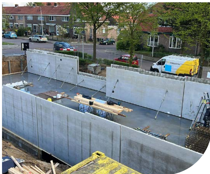
Bouwplaats On The Hill Arnhem

We leveren prefab onderdelen just-in-time, minimaliseren de transportbewegingen en maximaliseren de ruimte op onze bouwplaats. Dankzij de just-in-time productie en levering is er een optimale doorstroom en kunnen we transportbewegingen van de fabriek naar de bouwplaats tot een minimum beperken. Aan de hand van het BIM model hebben we de inrichting van de bouwplaats kunnen optimaliseren.